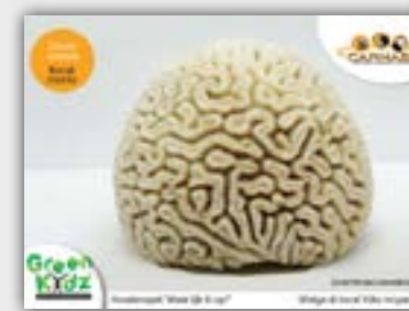
Coral Heroes Koralenspel