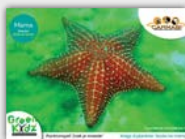
Coral Heroes Planktonspel