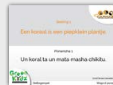
Coral Heroes Stellingenspel